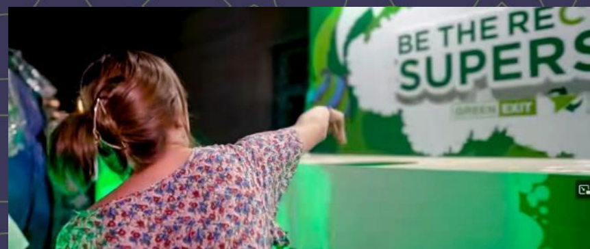
Green EXIT 2023 Aftermovie